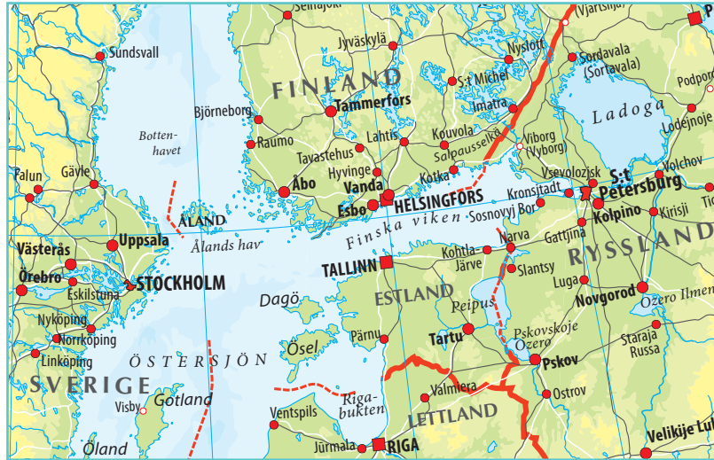
Skala 1: 10 miljoner