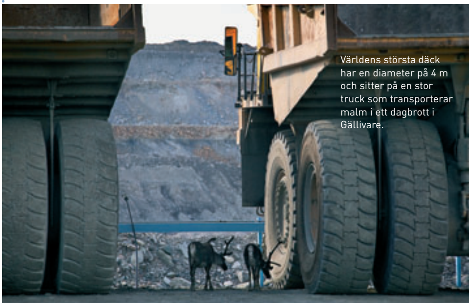
Världens största däck har en diameter på 4 m och sitter på en stor truck som transporterar malm i ett dagbrott i Gällivare.